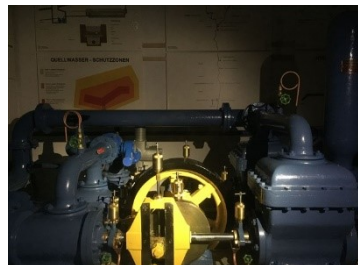
Kohlbodenpumpe im Lorzentobel

Wir holen euch am Bahnhof in Zug ab und fahren zusammen mit dem Bus und der Zugerbergbahn weiter auf den Zugerberg. Nach einem Kaffeehalt im Bergrestaurant laufen wir zum Alprestaurant Brunegg, wo wir das Mittagessen einnehmen. Nach dem Mittagessen (ca. 13:30h) geht es weiter bergab durchs Lorzentobel. Nach einem Abstecher zur Kohlbodenpumpe laufen wir bis zum Bahnhof Baar. „Die Kohlbodenpumpe ist eine Art Perpetuum mobile, denn sie wird von einer höher gelegenen Trinkwasserquelle betrieben, um Wasser tiefer liegenden Quellen über die Höhe bei Baarburg zu pumpen“.