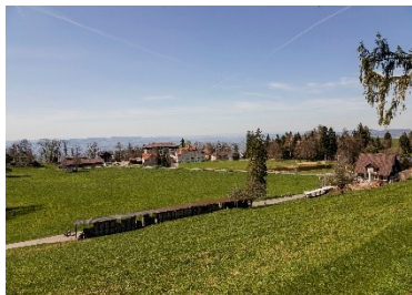
Zugerberg Start der Wanderung

Tourenbeschreibung: Zugerberg – Sätteli – Hünggi – Zigermoos – Brunegg - (Mittagsrast) - Höllgrotten – Höll – Baar SBB.